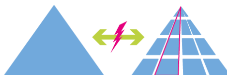
Zusammenspiel bildungsrelevanter Aspekte vs. Strukturen im Bildungsbereich

→ Die Strukturen im Bildungsbereich werden der Komplexität von Bildungsprozessen kaum gerecht.